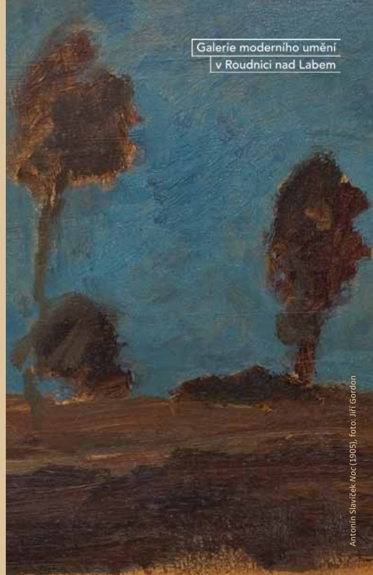
Antonín Slavíček Noc (1905)