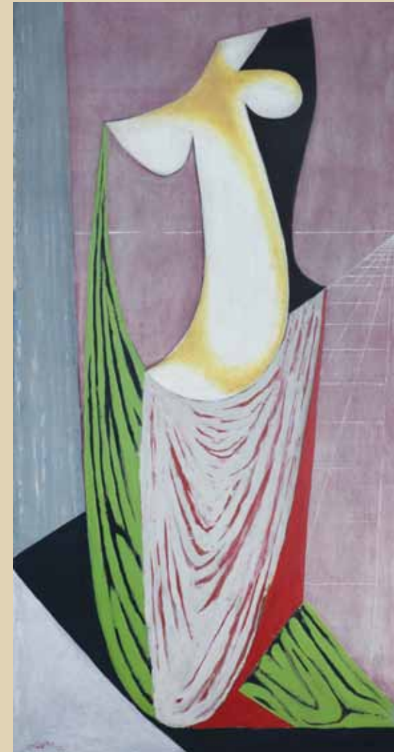
František Muzika Torso s drapérií 1937

GALERIE MODERNÍHO UMĚNÍ V ROUDNICI NAD LABEM Ošková 5, 413 01 Roudnice nad Labem, www.galerieroudnice.cz telefon: + 420 416 837 301, e-mail: galerie@galerieroudnice.cz