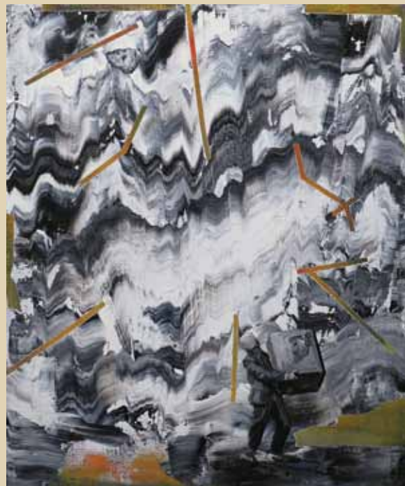
Ondřej Basjuk Muž s vlastnostmi: Sběratel 2018