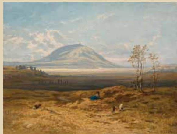
Julius Mařák Říp (studie k výzdobě Národního divadla v Praze) (1882–1883), Národní galerie v Praze