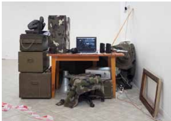
Pohled do instalace výstavy War Zone 2017